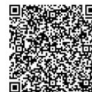
申込みフォームQRコード