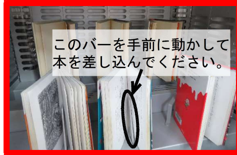
②本の真ん中あたりを開いてスタンドにセットしてください。