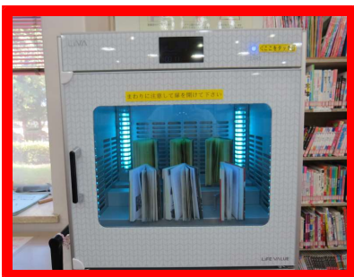
④ライトがつき除菌を开始します。