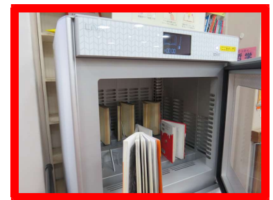
⑥とびらを開けて本を取り出してください。