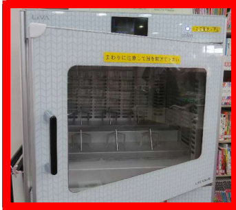
①とびらを開けてください。