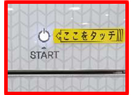
③スタートボタンをタッチします。